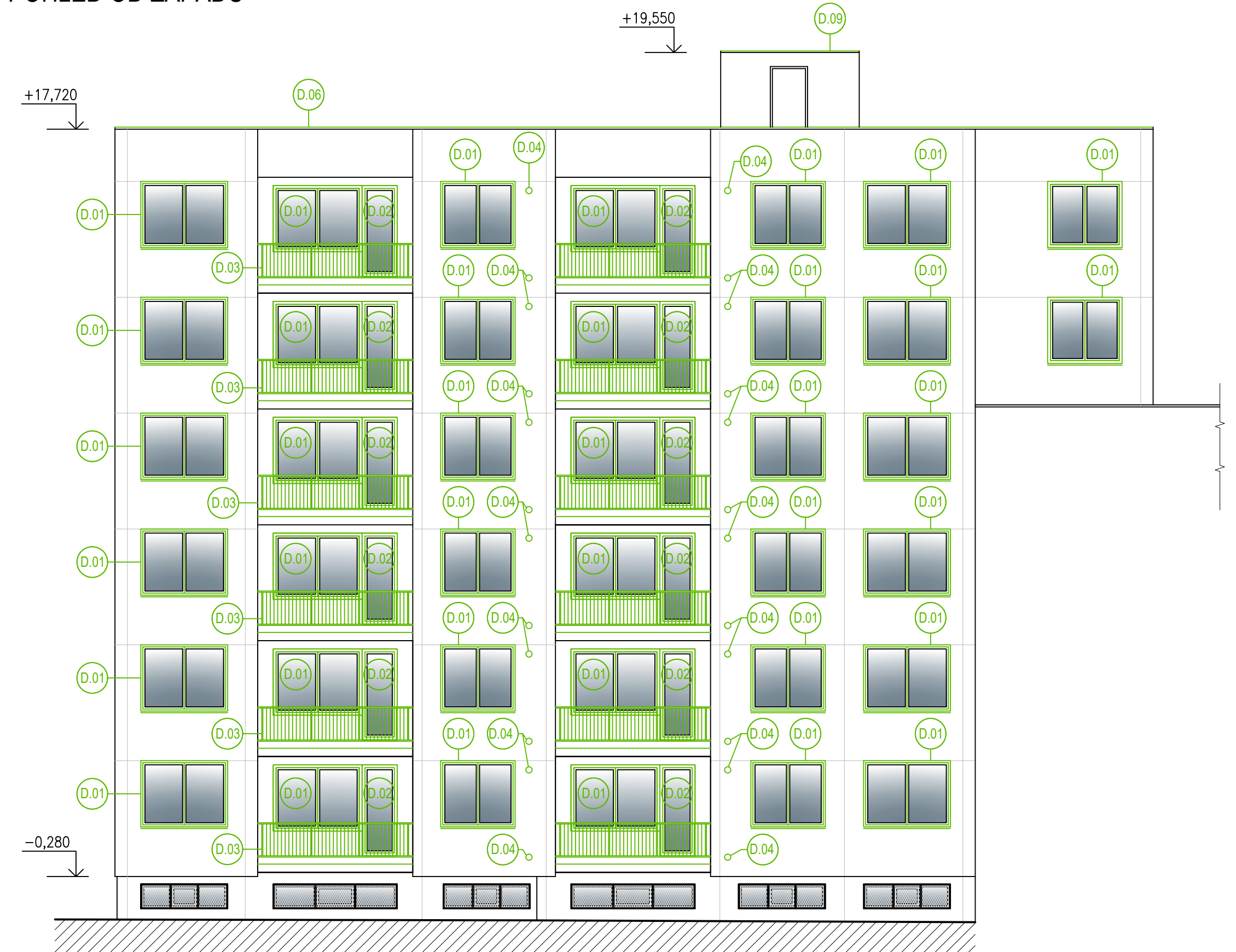
POHLED OD ZÁPADU