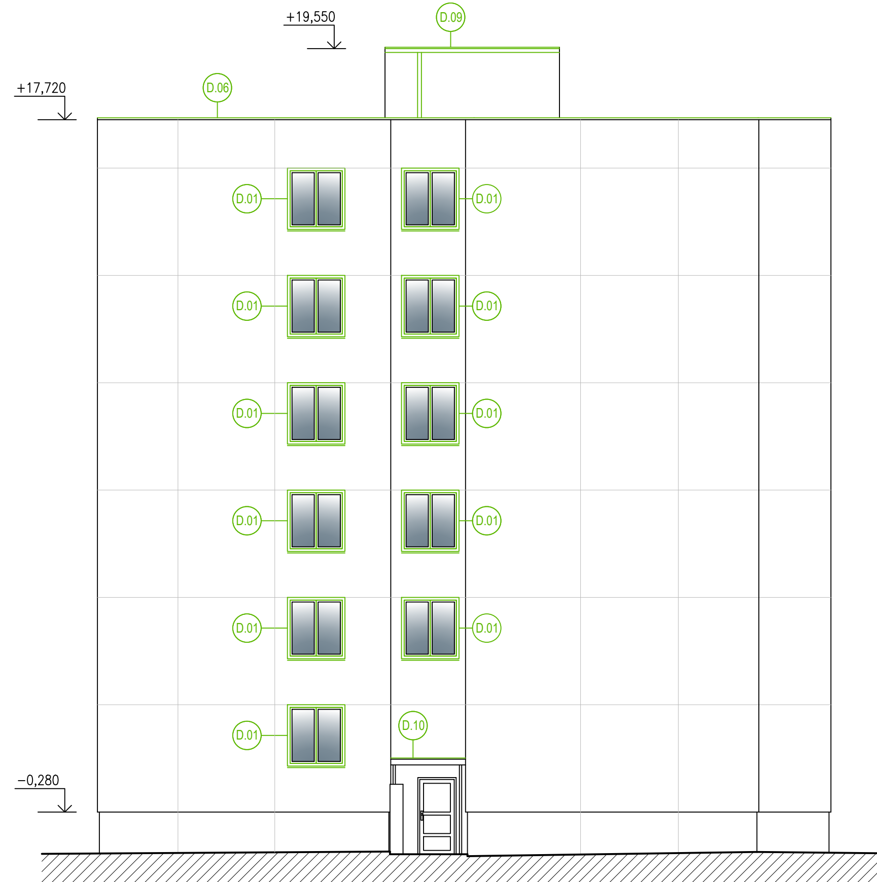
POHLED OD SEVERU